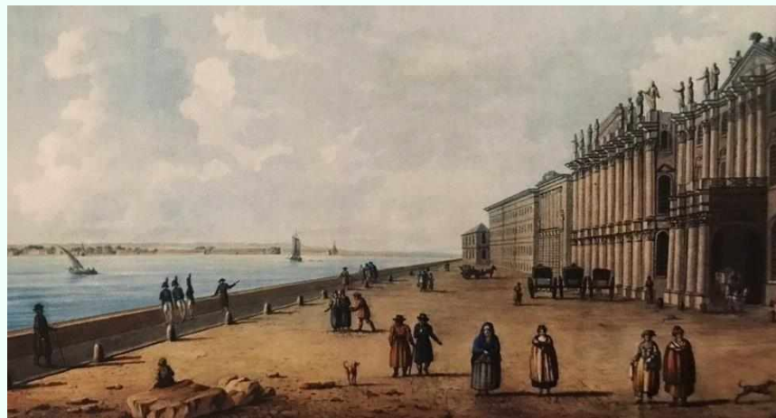
Адмиралтейская набережная. Художник Беггров А. К.