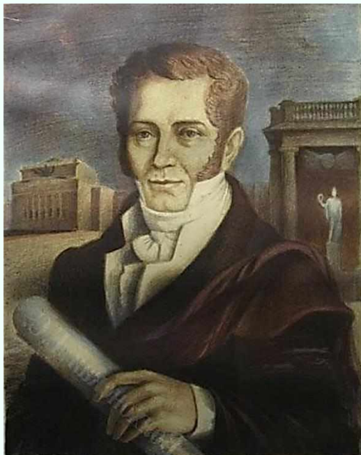
Карл Иванович Росси (1775 -1849)