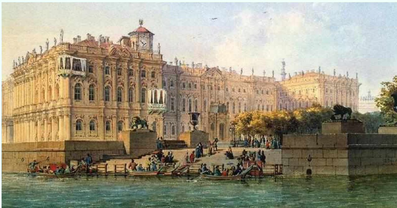
В. С. Садовников. Вид пристани на Неве у Зимнего дворца. 1840-е

Монотонность вертикального параллелепипеда пьедестала разделена неширокими выступами. Сам лестничный спуск с боков ограничен парапетом набережных.