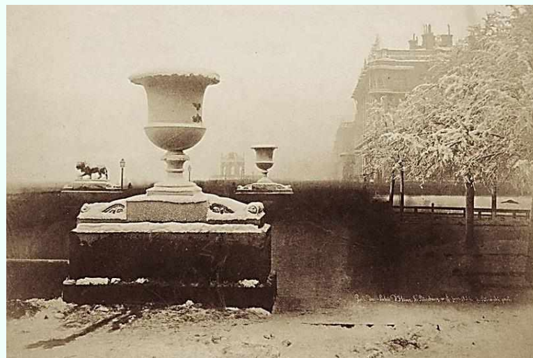
1854 г. Ваза на Дворцовом спуске

В начале XXI века используются различные названия пристани. Это отчасти объясняется тем, что пристань отделена от Зимнего дворца транспортным потоком, движущимся через Дворцовый мост. Пристань называют «Причал у Адмиралтейства», «Пристань со львами» или «Спуск со львами», «Дворцовый спуск».