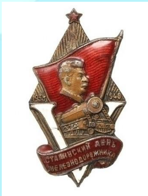
Значок «Сталинский день железнодорожника». НКПС, 1940.

29 июля 1936 года вышел экстренный выпуск газеты «Гудок», который начинался с постановления правительства СССР «О праздновании Дня железнодорожного транспорта Советского Союза». День железнодорожного транспорта Советского Союза был объявлен всенародным праздником, первое его празднование было в кратчайшие сроки организовано по всей стране.