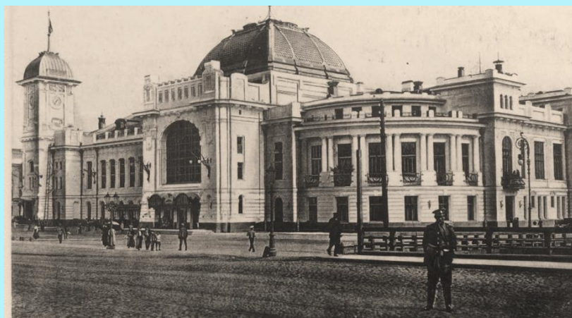
Санкт-Петербург. Царскосельский вокзал (почтовая открытка)

В этот день на крупных станциях и вокзалах устраивали благодарственные молебствия. Особенно торжественно прошло оно на набережной Фонтанки у дома 117, у здания Министерства путей сообщения.