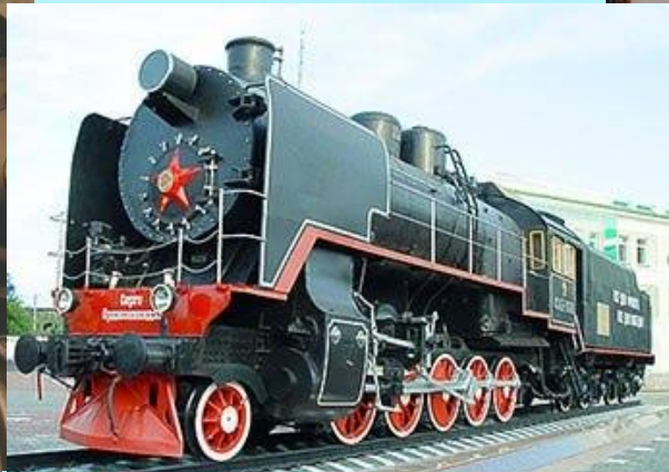
С Днем железнодорожника!