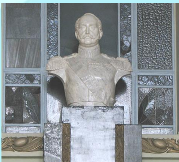
Первый железнодорожный вокзал в Павловске

Столичное торжество завершилось праздничным обедом в Павловске на Царскосельской дороге. На вокзале Царскосельской железной дороги был открыт мраморный бюст Императора Николая I.