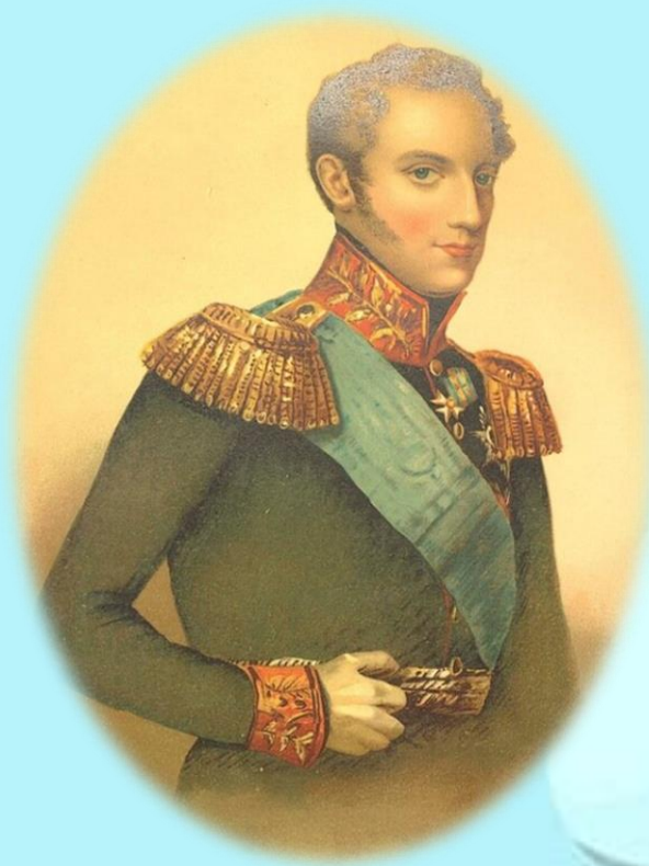
Император Николай I

«Государь Император в ознаменование дня рождения Императора Николая I, державной волею коего положено начало сооружения и эксплуатации железных дорог в России, по всеподданнейшему докладу нашему, 28 июня сего года Высочайше повелеть изволил: установить ежегодное празднование годовщины Императора Николая I всеми центральными и местными учреждениями, заведывающими железными дорогами в России. О таковой Высочайшей воле объявлено по ведомству путей сообщения». — Министр путей сообщения князь М. Хилков.