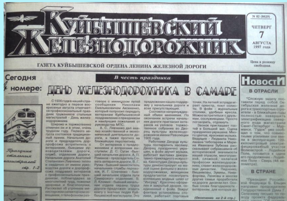
Газета Гудок 7 августа 1997 г.

Президент России В. В. Путин в одном из своих поздравлений в честь Дня железнодорожника отметил: «В отечественном железнодорожном комплексе всегда работали специалисты высочайшей квалификации — настоящие профессионалы, хорошо знающие и любящие свое дело. Вы по праву можете гордиться славыми страницами истории отрасли, ее достижениями и успехами».