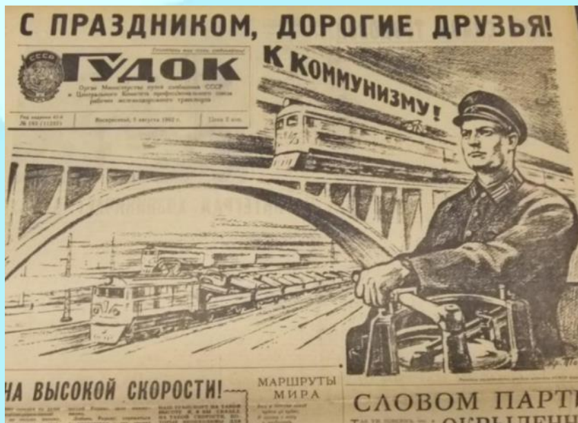
Газета Гудок 5 августа 1962 г.

С 1980 года профессиональный праздник работников железнодорожного транспорта был установлен указом президиума Верховного Совета СССР «О праздничных и памятных днях» от 1 октября 1980 года № 3018-Х, который продолжает действовать и исполняться в XXI веке.