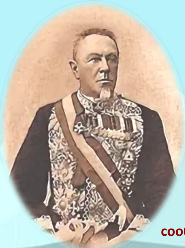
Министр путей сообщения М. Хилков