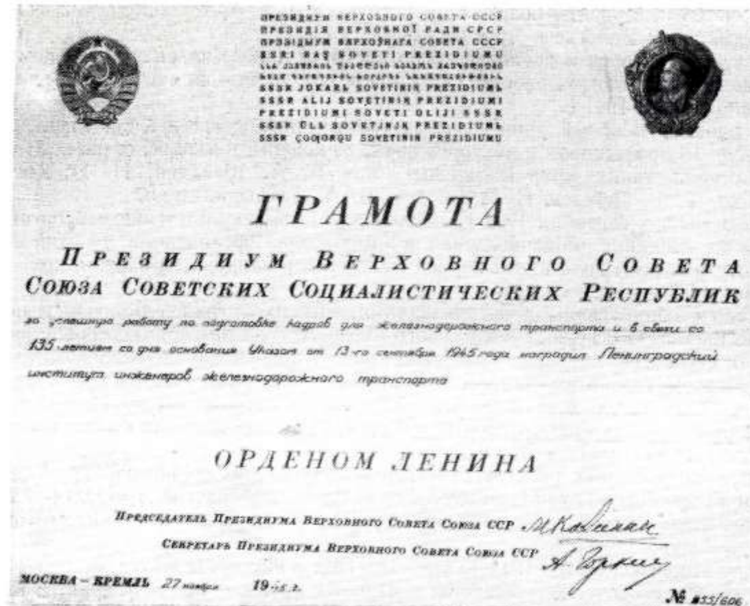
Грамота Президиума Верховного Совета СССР

В этом же году «за успешную работу по подготовке кадров для железнодорожного транспорта и в связи со 135-летием со дня основания» Президиум Верховного Совета СССР наградил ЛИИЖТ высшей наградой страны - орденом Ленина.