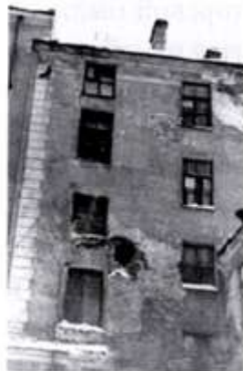
Жилой дом профессоров и преподавателей Института (ныне 11-й корпус, на фото слева) и 12-й (ныне 2-й) корпус со следа поражения вражескими артиллерийскими снарядами. Фото 1941–1944 гг.