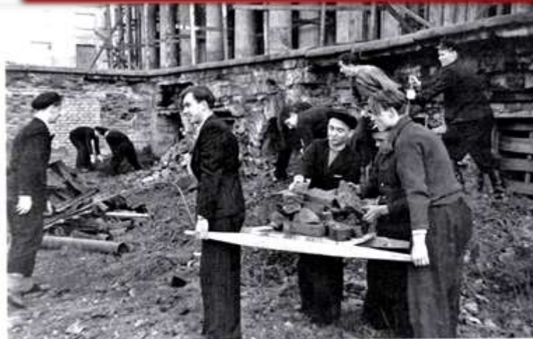
Студенты ЛИНБИТ на работах по восстановлению Дворца Юсуповых на Фонтанке. 1945 г.