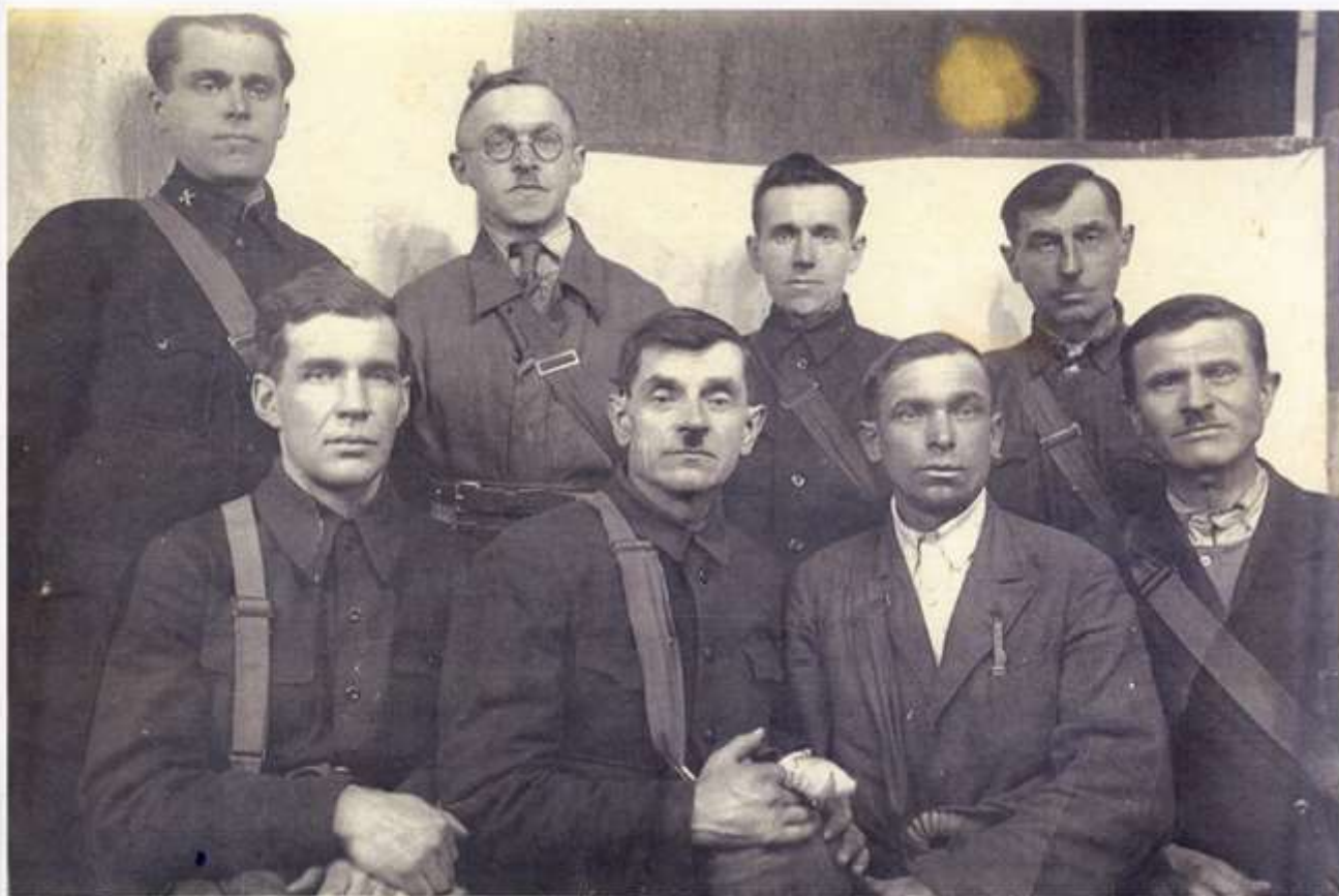
Пожарная команда МПВО ЛИИЖТа. Май 1942г.

На район, где расположен ЛИИЖТ за сентябрь-октябрь 1941 года было сброшено 134 фугасных, 7911 зажигательных бомб и упало 233 артиллерийских снаряда. Для защиты института от пожаров и повреждений были созданы отряды МПВО. Бойцы отряда обезвреживали бомбы, сбрасывали их с крыши, засыпали песком или опускали в воду.