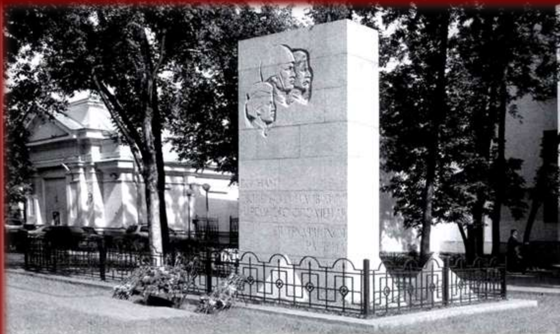
Памятная стела на Садовой улице Санкт-Петербурга. С этого места 4 сентября 1941 г. ушли в бой за Ленинград воины-ополченцы Октябрьского района, в их числе сотрудники и студенты ЛНИИЖТ. Фото 2009 г.