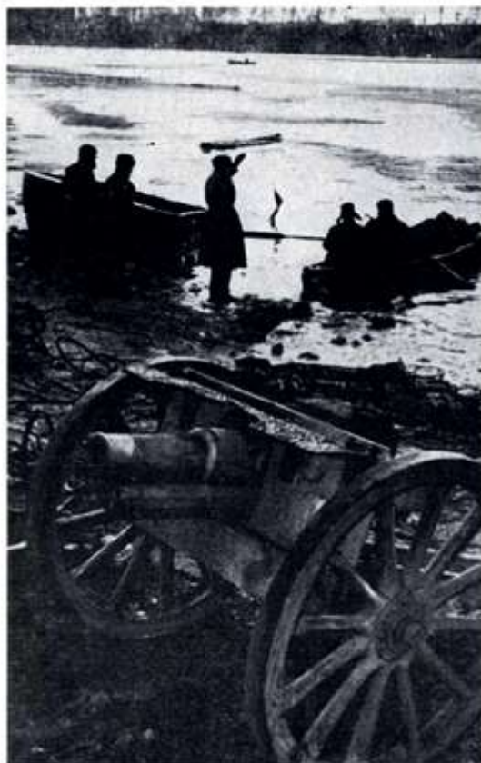
Переправа на Невский пяточок

Лийжтовцы сражались в ожесточенных боях за Невский «пяточок». «Пяточок» находился под постоянным огнем противника, авиационными бомбами, артиллерийскими снарядами.