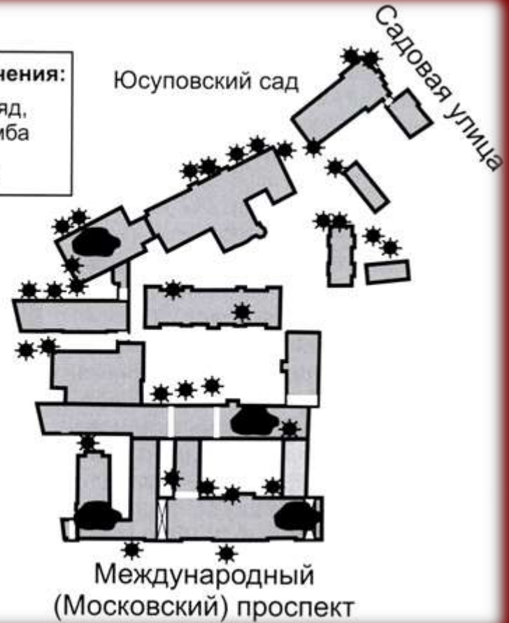
Схема поражений зданий Института во время блокады Ленинграда