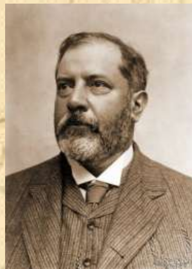
Леонтий Николаевич Бенуа (1856 – 1928)