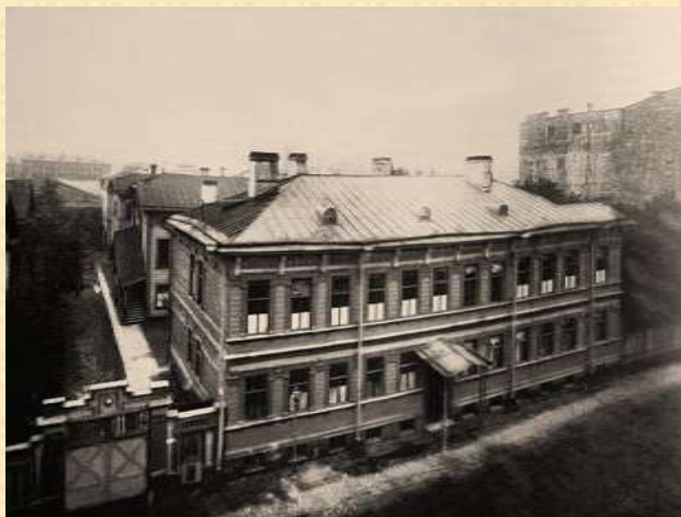
Главное здание приюта для мальчиков