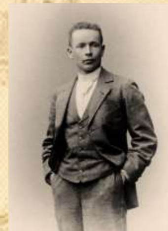
Готтлиб Элиэль Сааринен 1873-1950