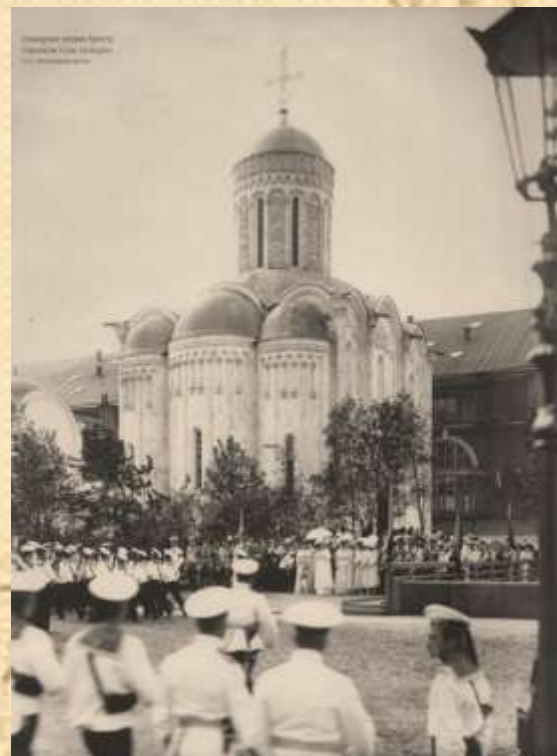
Освящение храма. 1911.