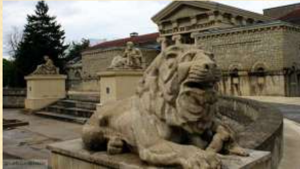
Грязелечебница в Ессентуках