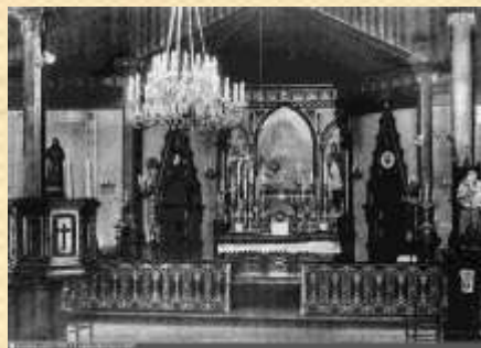
Каплица при убежище для бедных мальчиков