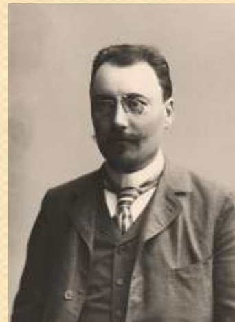
Ларс Элиел Сонк 1870 - 1956