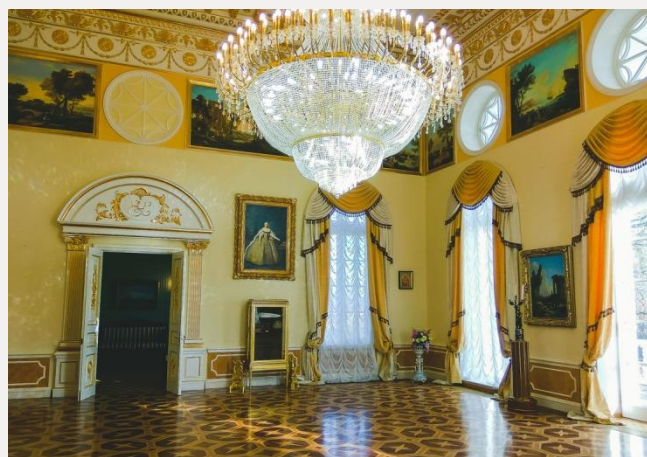
Главный зал дворца