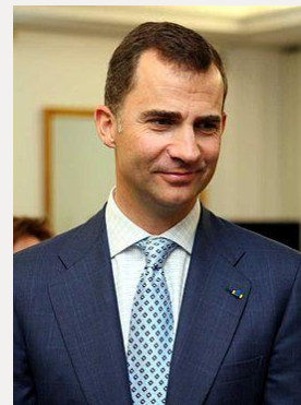
дон Фелипе Астурийский