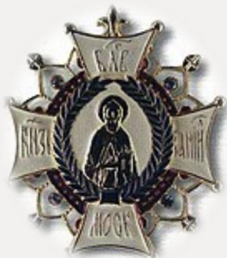
Орден Святого Даниила