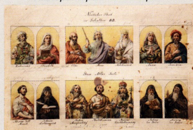
Эскизы икон для северной алтарной преграды Исаакиевского собора 1847