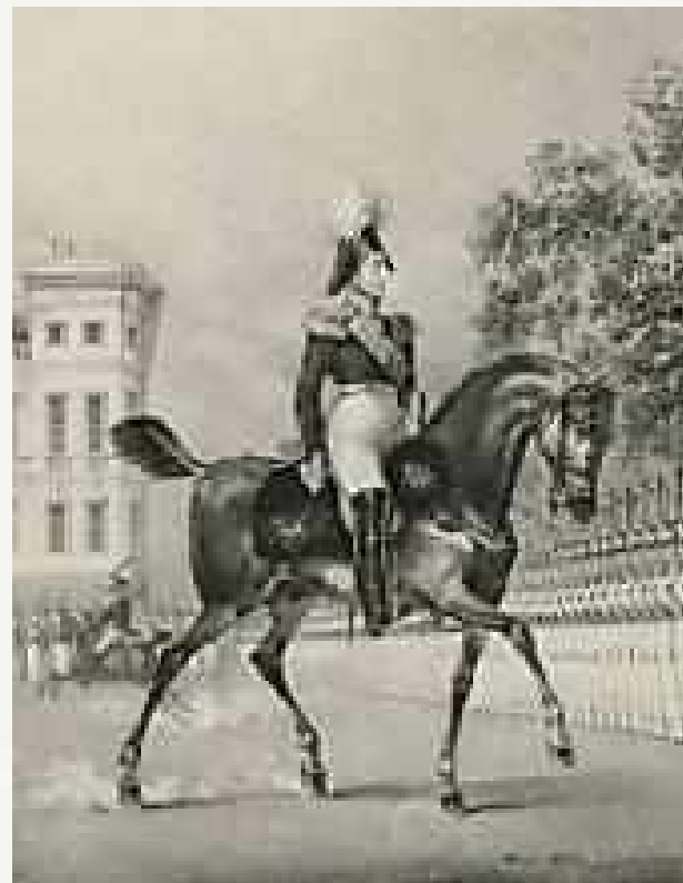
Портрет императора Николая I, вторая четв. XIX в., бумага, литография