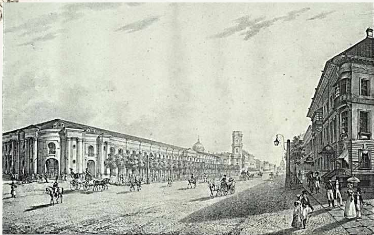
Вид Гостиного двора