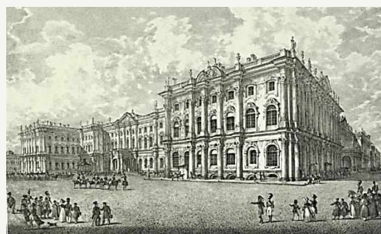
Зимний дворец со стороны Адмиралтейства