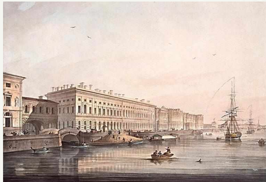
Вид Дворцовой набережной. 1826 г. Авторы рисунка: Сабат К. Ф., Шифляр С. П., бумага, литография, акварель

Более половины листов издания было перенесено на литографский камень К. П. Беггровым. В их число вошли пейзажи парадного Петербурга, на которых изображены Дворцовая набережная, Невский проспект и Васильевский остров.