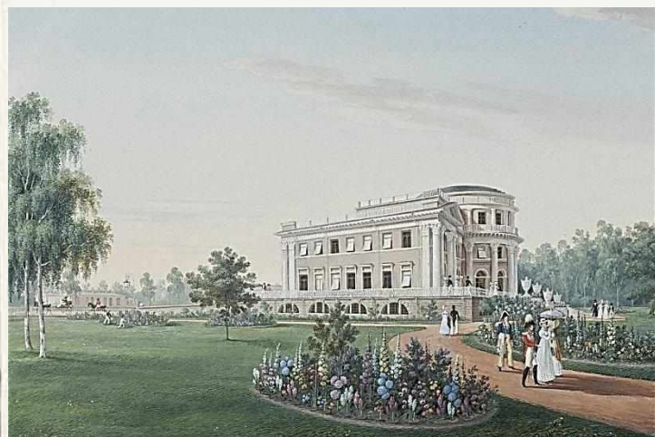
Вид Елагина дворца. 1823 г., бумага, гуашь