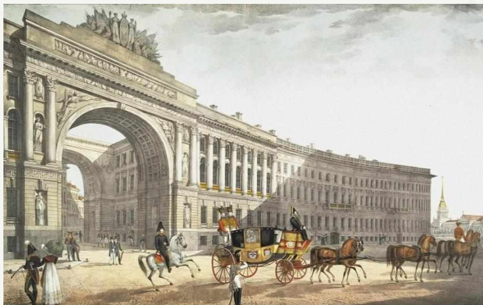
Вид на арку Главного штаба. 1822 г. Автор чертежа: Росси К., бумага, литография, акварель

Все пейзажи Петербурга, созданные художником для данной серии, выполнены с любовью к родному городу и с истинным мастерством. Сегодня коллекционерами старинных картин особо ценятся литографии, раскрашенные Бегровым лично.