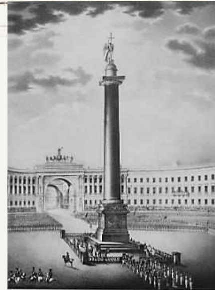
Литография К. П. Бегрова, бумага.

Изображен вид на Александровскую колонну и здание Главного Штаба. Зафиксирован эпизод торжественного открытия Александровской колонны: на площади выстроены войска, а вдоль здания Главного Штаба за деревянной оградой разместились публика; вокруг колонны за ее оградой священнослужители в ризах совершают освящение с крестным ходом.