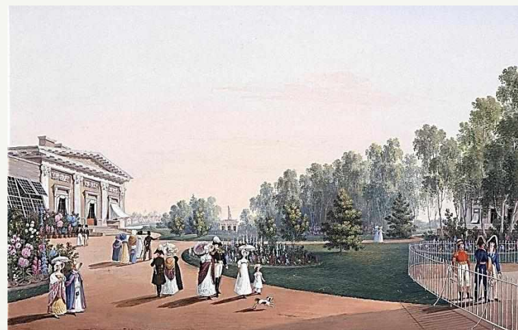
Вид парка возле служб Елагина дворца. 1823 г., бумага, гуашь