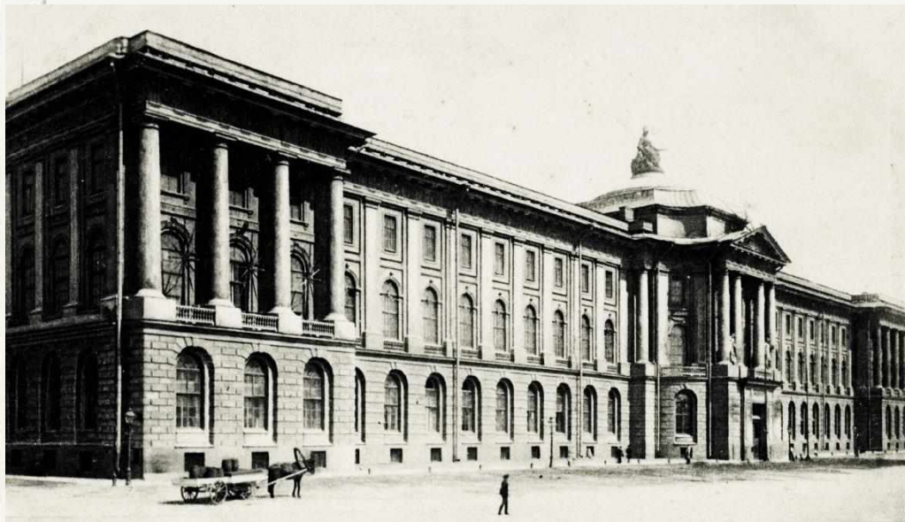
Императорская Академия художеств в Санкт-Петербурге

Карл Петрович Бегров, русский художник немецкого происхождения, родился 15 февраля 1799 года в Риге. С 1812 по 1821 гг. учился в пейзажном классе Императорской Академии художеств у М. Н. Воробьева, русского живописца и рисовальщика, основоположника и крупнейшего мастера романтико-классицистического пейзажа первой половины XIX века. Он был наставником многочисленной группы учеников, известной в историографии под его именем — воробьевской школы.