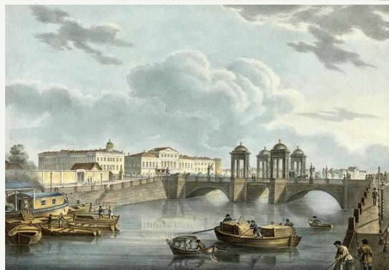
Фонтанка у Обуховского моста