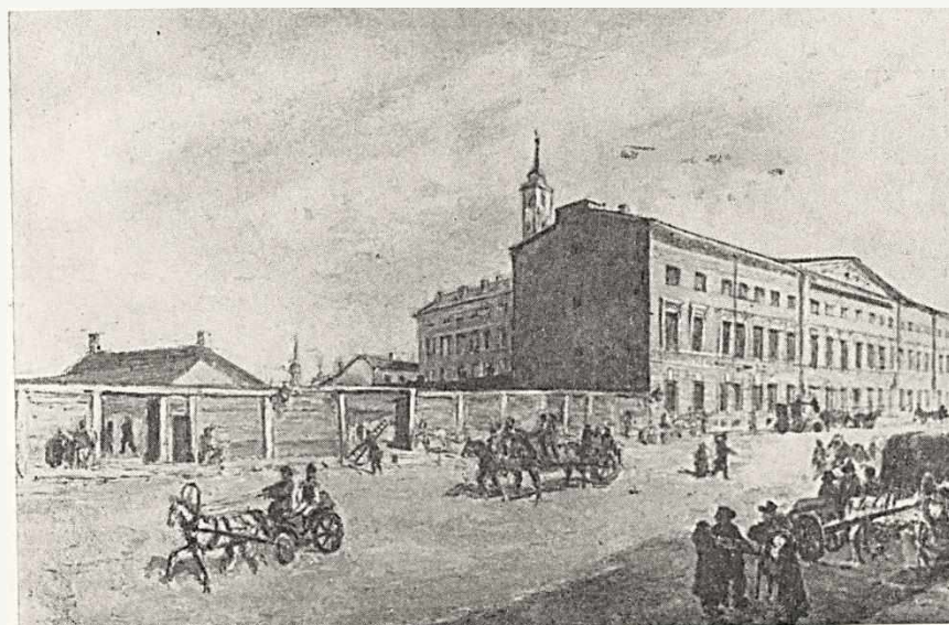
Институт инженеров путей сообщения в 1823 г. (с акварели К. Беггрова)

Литограф при Корпусе путей сообщения, создатель видов мостов, набережных и зданий, созданных инженерами корпуса путей сообщения