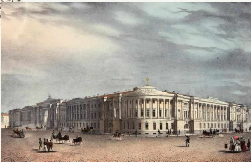
Вид зданий Сената и Синода. 1830-е, бумага, литография, акварель