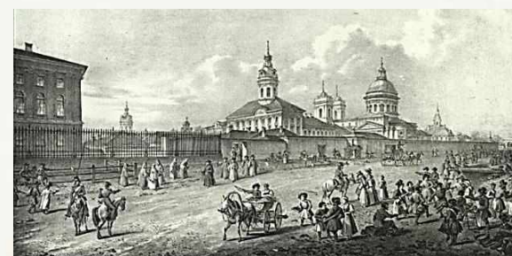
Лавра Св. Александра Невского