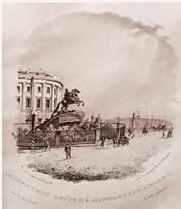
«Монумент Петру I-му». Рисовал с натуры Садовников. Рисовал на камне Академик К. Беггров. 1830 г. – редкая литография.

Помимо портретов К. Беггров создавал литографии для различных альбомов. В 1820 году он участвовал в создании «Альбома литографий на 1820 г.», в 1822 году работал над альбомом «Народы, живущие между Каспийским и Чёрным морями», литографировал военно-исторические сюжеты — всего получилось два альбома и некоторое количество листов.