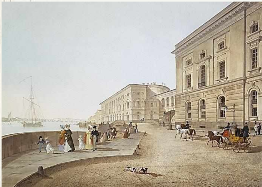
Вид набережной Невы у здания Старого Эрмитажа. 1824 г., бумага, акварель, гуашь,

Петербургские пейзажи признаны самым значительным явлением молодой русской литографии. Эта серия была отпечатана в разных мастерских. Как правило, над каждым листом серии работала пара авторов — один исполнял оригинал с натуры, а другой переводил его на камень.