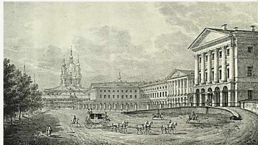
Воспитательное общество благородных девиц