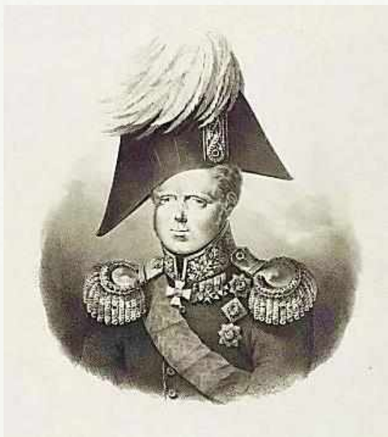
Портрет великого князя Константина Павловича Россия, 1825, литография