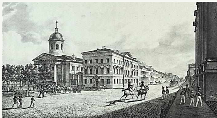
Лютеранская церковь Св. Екатерины